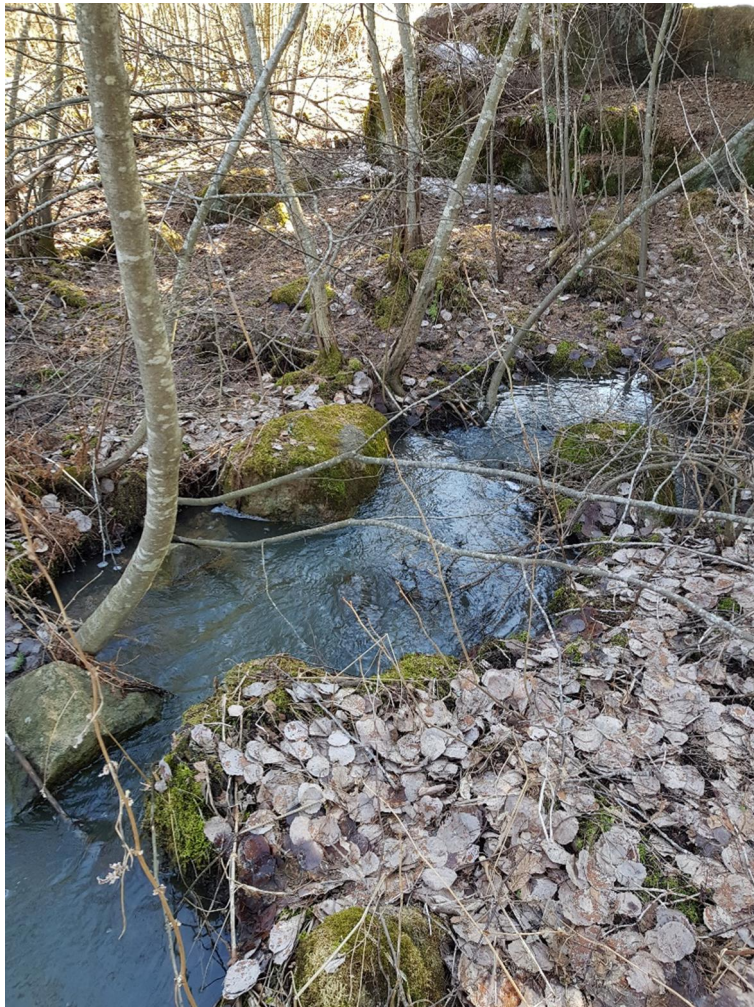
Kuva 2. Luonnontilaisen noron uomaa Kirkkotien lähellä.

runsaasti harmaaleppää, raitaa ja haapaa ja jonkun verran varttuneempaa kuusta. Kasvillisuus vaihtelee lehtomaisesta kankaasta lehtoihin siten, että rehevintä lehtoa (saniaislehtoa) tapaa kuvion pohjoispäässä. Kuvion keskiosissa esiintyy pieniä, karunpuoleisia soistumia. Kasvillisuuden valtalajeina koko alueella esiintyvät valkovuokko, kielo, mustikka, käenkaali, lillukka, ahomansikka, metsäorvokki, sormisara, oravanmarja ja metsäimarre. Lehtolaikuilla kasvaa runsaasti myös hiirenporrasta, korpi-imarretta, kivikkoalvejuurta, sudenmarjaa, metsäruusua, taikinamarjaa ja mustaherukkaa. Kuvion pohjoisosassa tavattiin kaksi yksilöä harvinaista pussikämmekkää ( Coeloglossum viride ).